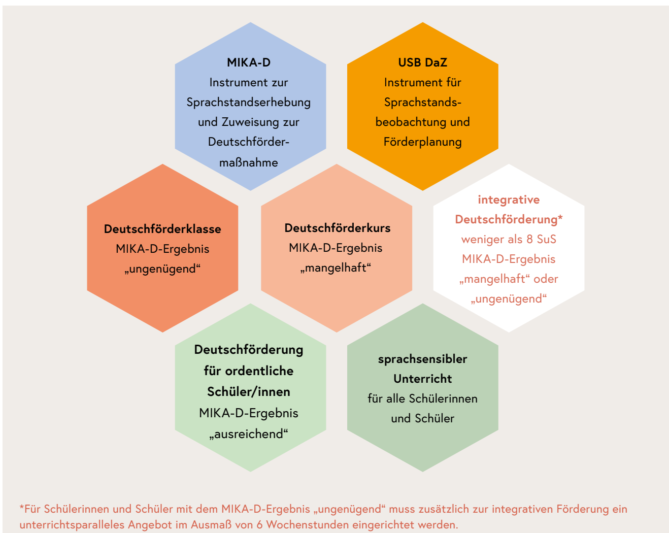
Abb. 1: Elemente des Modells der Deutschförderung in österreichischen Schulen

Um die Deutschförderung möglichst treffsicher und bedarfsgerecht durchzuführen, sind folgende Instrumente und Förderformate vorgesehen, die sich gegenseitig ergänzen und ineinandergreifen.